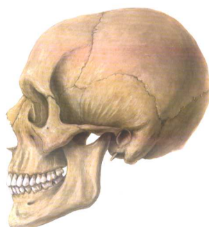
Obrázek 5. Lebka (autor, rok vydání)

Při používání barev a různých barevných odstínů v tabulkách a grafech je nutné mít na paměti, že se nejedná o reklamu na výrobek.